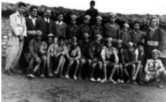
سەر و چاوه، له ۲۱/۴/۱۹۶۰ گیاره، هه‌شە قوتابخانهی گوندی سماقوولی