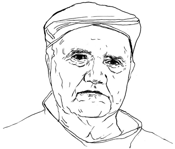
رۆسته م باجهلان

لێ کردم. سهبردهی گیرانی خۆی له لایه ن دائیره ی ئەمهی ههولیر بۆ گێڕایه نه وه ئەو رۆژه، یهک دوو رۆژ بوو ئازاد کرابوو.