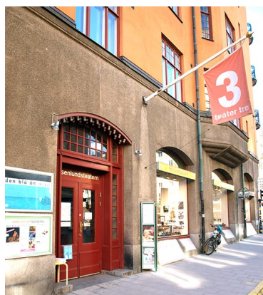
شانۆی (تیاتر ۳) له ستۆكهۆلم كه شانۆی گێژهنی تیتدا نمایش كرا

یه كه مین جار بوو دهست بۆ شانۆنامه یه كه خۆمالی بهرم، ئه وه بوو وهك پێشتر گوتم، ههچیان نه گه یشتنه نمایش، ئه م ئه زمونه بۆ ئه كته ره كان وهك ئه وه وابوو كه مه شق و راهینانیان كردییت، ئه و تاقیكردنه وانه راسته جوژه بێزاریبه كه له لایان دروست كردبوو، به لام بێ ئه نجامیش نه بوون، بۆ ئه كته ره كانیش، راهینانیكی باش بوون، نهك ته نیا بۆ ئه كته ره كان، ده توانم بلێم بۆ خۆشم راهینانی باش بوون. ئه و سالانه ی پێش شانۆی گێژهن، راسته ههچ ههولێكیم تاكو نمایش بری نه كرد، به لام وهك ریژیسۆر نه وهستا بووم و له كار نه كه وتبووم.