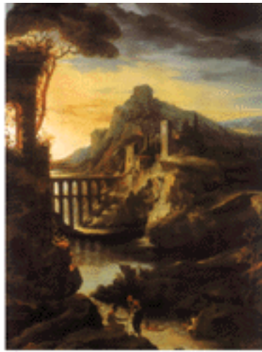
نابلو، جبرئیل - فرانسہ