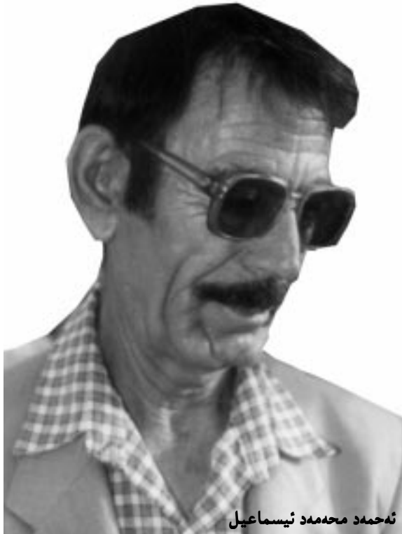
نهمهد مههمهد ئيسماعيل

شوتنه، له‌دهست بدات، ئه‌وا پیناسه‌ی بوونی نه‌ته‌وه‌یی له‌دهست ده‌دات و به‌ره‌و سهرینه‌وه مل ده‌نیت. بۆیه نووسهران وای بۆ ده‌چوون هه‌میشه شوتین چ به‌مانا جوگرافیه‌که‌ی یان مانا ره‌مزیه‌که‌ی، ده‌بیت هه‌وتینی چیرۆکه‌کان بیت.