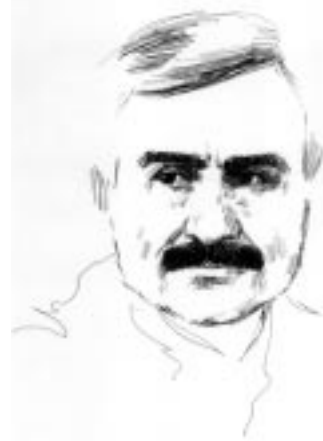
نه ژاد عزیز سورمی