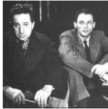
نارسه‌ر میلیله‌ر و ئیلیا کازان

میلیله‌ریش وه‌کو سارته‌ر گه‌لی که‌سی زولم لیکراو و سته‌مدیده له‌ هه‌ر گۆشه‌یه‌کی جیهانه‌وه بێ، په‌نایان بۆ ده‌برد و به‌رگری لێده‌کردن. رۆژنامه‌نووسی سویدی «کریستینا روسینکڤیست» ئه‌م رووداوه ده‌گێرتنه‌وه: «جاریک نووسه‌ری ئه‌فریقای وول سوینیکا له‌ لایه‌ن سه‌رکرده‌یه‌تی بالای سوپای نیجیریاوه بریاری کوشتنی درابوو، که‌ میلیله‌ر له‌ نیویۆرک ئاگادار کرایه‌وه، بێ