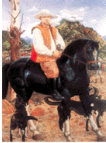
تاپقۇر، قۇرۇم ئورمانى - تاشقۇر