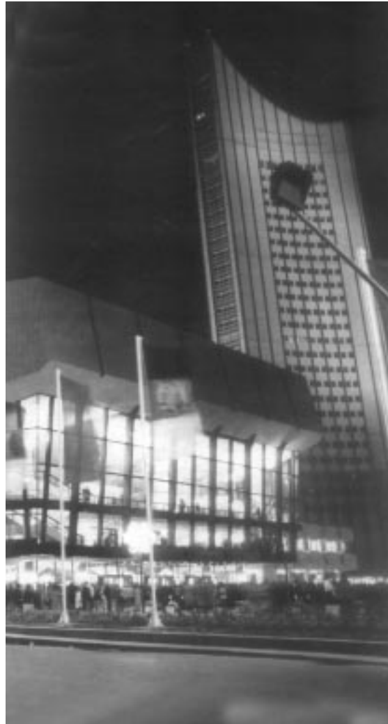
دو شىوہ تەلارسازى رۆژئاواى - ئەورپا