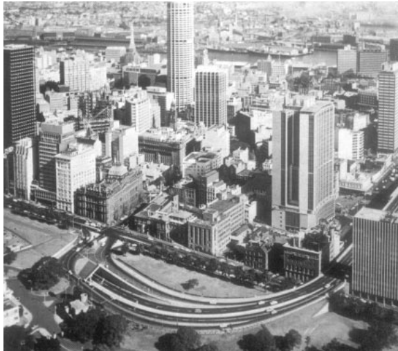
تەلارسازی - ژاپون

شۆرەتی تەلارسازی بە بەرۆکیهوه خرا.. - هنری سۆفاج - «۱۸۷۳ - ۱۹۳۲» ی فەرەنسەش یەکیک بوو لەسوارچاگانی بواری تەلارسازی. - ئینجا «لویارون جینی» ئەمریکی که لە شیکاگۆ مەزنتەرین ساختمانی دروست کرد.. - لویس سولیشان - ئەو تەلارسازە بەناوبانگە بوو که لە شارەکانی شیکاگۆ نیویۆرک. دەستپێشخەری لە دروستکردنی یەکەم ساختمانی جۆری زەبەللاهی بالابەرز «ناطحات السحاب» کرد..