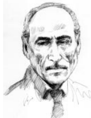
جهلیل کاکه وهیس