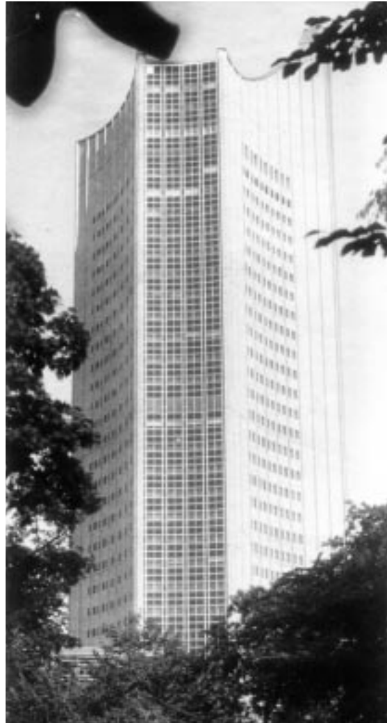
بالاخانىيەكى زەبەللەح لە ئەلمانىا

دەھات لەسەر پانتايى زەوييە ئامادە كراوہكە دووبارەى دەكردوہ.. بەلج «بست ياخود درىژى پى يا شاقاو بەكارھىتان» لە پىتوہرە ھەرە ديارو باوہكانى نىو كۆمەلگەى كوردەوارى بووہ بۆ مەبەستى جىاجىا لەوانەش بۆ «كارى پىتوہرى نەخشەو بىناكارى» كەوابوو ئىستا «ئەندازىارىكى تەلارسازی» ناتوانى پەنا بۆ ئەو توخمە گرنگە كە «ھىل» ە نەبات، بەلام ئەو یش بەجۆرەھا ستايل و كەرەستە و ئامپىر و عقلىكى سەردەمانە پىشوازى لىدەكا!!