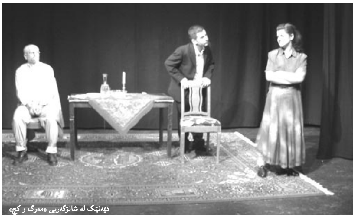
دیهنیک له شانزگهری «مهرگ و کچ»

۷- شانزنامه‌ی (مهرگ و کچ) نووسینی نارینیل دۆرفمان، وهرگپران و دهرهینانی فازل جاف. ئەم شانزنامه‌یه له کۆتایی مانگی گولانی سالی (۲۰۰۴) دا له شاری ستۆکهۆلم بۆ ماوه‌ی سێ رۆژ نمایش کرا، بربار وایه له چەند شارێکی دیکه‌ی سوید نمایش بکریته‌وه.