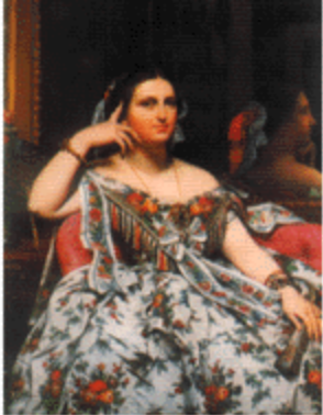
تابلو: ہینگریس - لہرنسیا