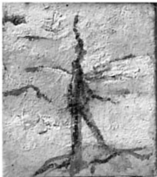
تابلۆی هونه رمه ند «ناری بابان» (۱سم × ۹مم) - ناوی

دووه میشیان زیدی له دایک بوونی (پاتک) ی باوکی مانیه که له هه مه دان له دایک بووه و په روهرده و گه وره بووه تا ساڵی (۲۰۷) زاینی تیداما وه ته وه له ویش ژنی هیناوه شاری ئە کبادانیش (هه مه دان) مه لبه ندیکه کوردنشین و (قه لای به هار) ی نزیک ئەو شاره ش له به ری باکووری خۆرئاوای به وته ی مێژوونوسی ئیرانی (حه مه دولا ئەلمسته وهی ئەلقه زوینی) نه ک هه ر ئەو سه ره ده مه ی پاتک-ی باوکی مانی له وێ له دایک بووه و ژباوه و ژنی هیناوه که تا سالانی دووسه دی زاینی ده کات، به لکو تا ناوه راستی سه ده دی چواره می زاینی پایته ختی ولاتی کوردان بووه که له شازده هه ریم پیکه هاتووه. بۆ زیاتر زانیاری پروانه [نزّه القلوب، باه تمام و تصحیح: گای لسترانج، بکوش: محمد دبیر