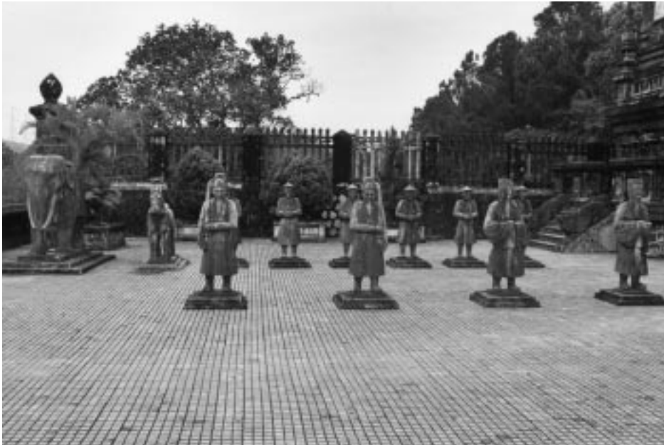
گۆره پانی گۆره پادشاییه کانی شاری هه رویتین

شیوازیکی شانۆیی تریش هه یه و زیاتر به شانۆی قسه، یان گفتوگۆ نازدهد کراوه (کیس نوۆ)، ره گوریشهی ئەم شانۆیهش دهگه رپتهوه بۆ شانۆی رۆژئاوا و شانیه شانی شانۆی مۆدیرنی فیتنامی له بیسته کانی هه زاره ی رابردوودا سه ری هه لداوه. ئەم شانۆیه ره واجیکی زۆری له نیوان قوتاییان و رۆشنیبه کاندای هه یه.