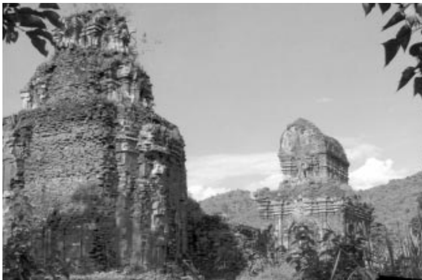
پاشماوه کانی کولتور و شارستانی شامه کان

۱- هونه ری شانۆ له ولاتی قیتنام، به چه شنی شانۆی رۆژهه لاتی مۆسیقا، گۆرانی، سه ما، هونه ری پانتۆمیم و دیالۆژ له خو ده گریت، ئەم هونه رانه ش پیکه وه و وه ک فۆرمیککی تایبه تمه ند کۆده بیته وه. شانۆی قیتنامیش له بنه رته دا له پینچ فۆرم و شیوازی جیاواز پیکه اتوه.