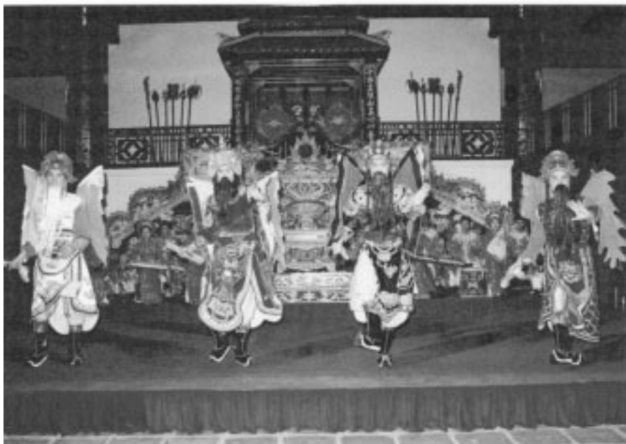
دپه نيك له نمايشيكى شانۆى شاهانه

قيتنام ناوه نديكى گرنگ و به ناوبانگى شوينه واره كاني كولتورى شامه كانه Cham- Kulturen، شارى