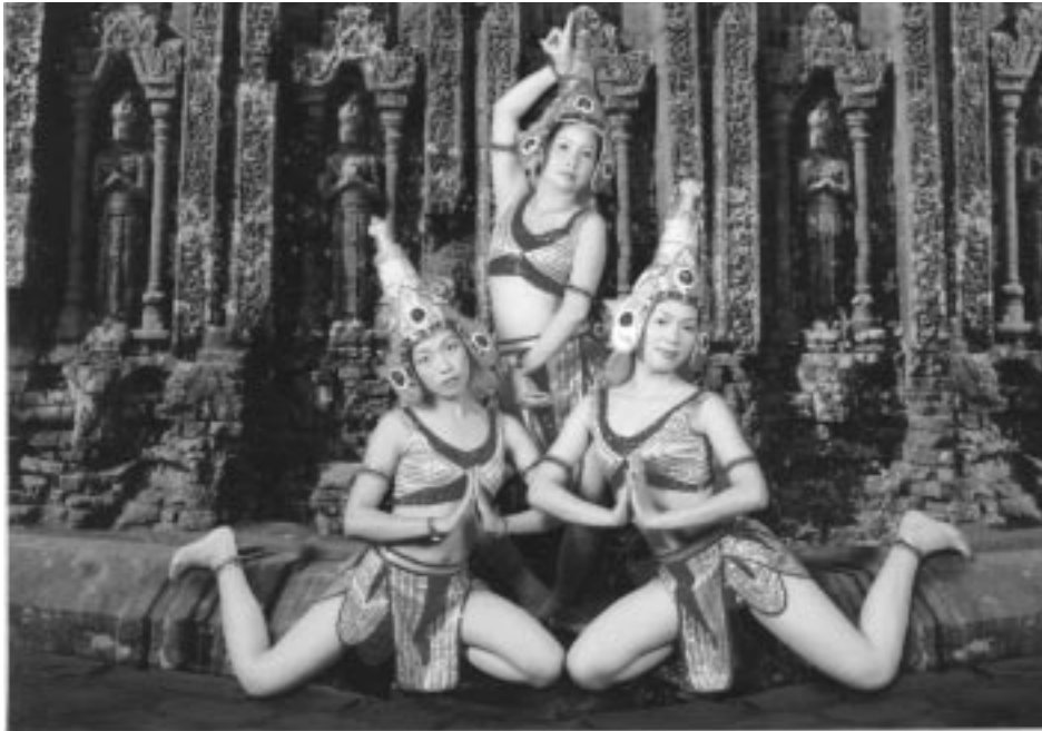
سەمازانەکانی سەمای شامی

پینمای ئۆرکیستراکە، ڕۆلە دیاریکراوەکانی خۆیان دەبینن. کارەکتەرەکانی ئەم ئۆپیرا کلاسیکییە لە شانۆی فیتنامیدا زۆر دیاریکراوە و بێنەرانی زۆر بە ئاسانی ئەو کارەکتەرە و سیمای ڕۆلەکانیان دەناسیتەو. بێگومان ئەو کەسایەتییانە دەمامک و جلوبەرگی تایبەت و نەگۆری خۆشیان هەیە، ئەم فۆرمەش دەروازەییەکی تری راستەوخۆی ناسینەوێتی ئەو کەسایەتییانە. بۆ نمونە دەمچاویکی سوور ڕەنگکراو، یان لە هەندێ هەلۆتستە جیاوازا، بە کارهێنانی دەمامکیکی سوور، هێمای نازایەتی، لایەنگیری و وەفایە، کارەکتەری توندوتیژ و خۆفروشهکان زیاتر دەموچاویان دەمامکی سپی لەخۆ دەگریت. خەلکی گوندنشین و بیابانەکان دەمامکی سەوز بە کار دەهێنن، بە پێچەوانەی خەلکی چیا نشینەکانەو کە دەمامکی ڕەش دەپۆشن. برۆی ڕەش و ڕێک نیشانە کەسایەتی ڕێک و راستە، برۆی بەرز و کەوانەییەش هێمای بە زەبرو زەنگەو برۆی نزمیش ئاماژە بە بۆ کەسایەتی ترسۆک و بێ هێز. کارەکتەریکی پیاو دەتوانی گوزارشت لە زۆر هەست و سۆزی جۆراوجۆر بکات، بۆ نمونە بێرکردنەوێتی قوول، دلەراوکی، توورەبی، شپرزەبوون، بێ ئارامی، تەنیا بەهۆی چۆنیەتی بە کارهێنانی پەنجە و دەست هێنان بەریش و سمیلدا.