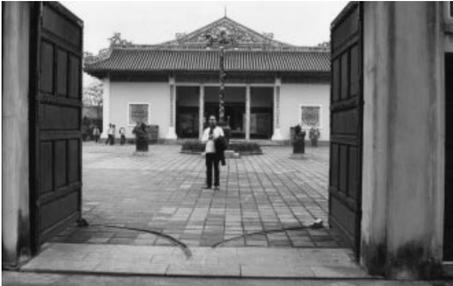
رووکاری دهرهوی شانۆی شاهانه له شاری ههوتین

ههروهها گۆزهکانی تو دیتو و کایدین Tu Duc, Khai Dinh ناماژیهیهکی ئاشکرای پووکانهوه و لاوازیوونی دهسهلاتی پادشایهتی خیزانی نیگیوینه. کۆمهلتی تووله ریتی باریک بهنیتو کیتلگهی برنج، شکر، باخ و باخات و ههندی جار دارستانی چر و رووباری گهورهدها بهرهو دهروازهی گۆزهکانت دهبات. (ئیسمه به پینماییی ری پيشاندهرهکافمان به بهلهم، ماتۆر و پیتی خۆمان دهگهیانده گۆزهکان.)