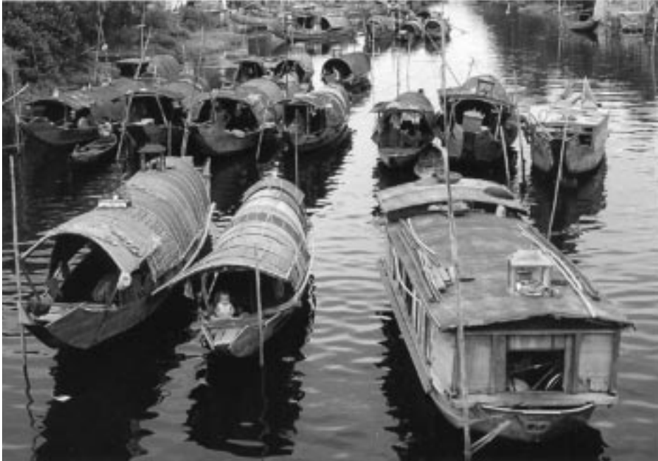
ژيان و گوزهرانی ځيټنامييه کان