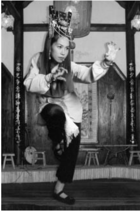
یه کیچک له کاره کتیره میلییه کانی شانزی فیتنامی

(می سۆن) یش My Son له دیر زه مانه وه بۆته ناوه ندیکی رۆشنبیری و ئایینی خه لکی شامه کان. هه ندی له بۆچوون و هه لکۆلینه ئه رکۆلۆژییه کانیش ئاماژه ی ئه وه ده که ن که ته نانه ت پادشاکانیشیان له ده ورره ی شاری هۆن ئان، ناوچه کانی می سۆن و چیا به رزه کانی ئه م ناوچه نه نیژراون.