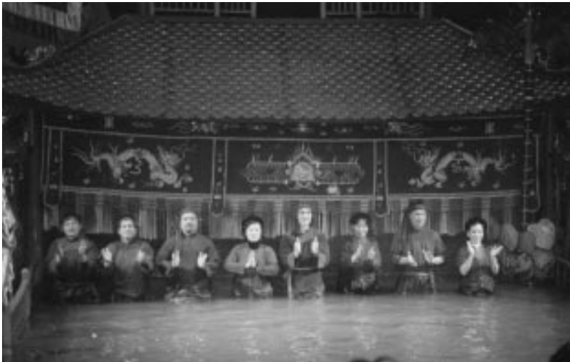
ئەکتەرەکانی شانۆی بووکەشووشە ناو

ئەم ڕۆگۆری سیزەرەکان لەم شارەدا بایەختی ئیجگار گەورەییە و سالانە لە شارەکانی تری قیتنام و ولاتی دنیاوہ ھەزاران کەس ڕووی تێدەکەن. لە ساڵی ۱۹۹۲و ئەم شارە لەلایەن ئۆرگانی یونسکووە وەک شاریکی کۆلتوووری جیھانی ناوزەد کراوه. لەم شارەدا ناوچەییەکی گەورە لە بەشی لای چەپی ڕووباری بۆنخۆش بەناوی (سیتا دیتل) ھوہ ھەییە، ئەم ناوچەییە نزیکەیی دە کیلۆمەتر درێژە و لە ساڵی ۱۸۰۴دا دروست کراوه. لەم ناوچەییەدا گەلیک پاشماوہی دێرینی بەنرخ لە کۆشک،