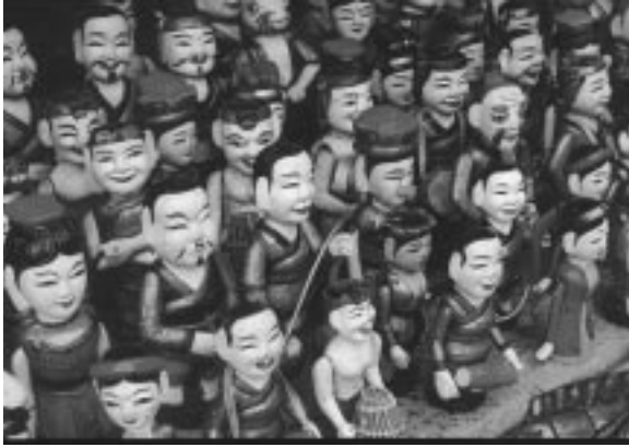
کاره‌کنه ناسراوه‌کانی شانۆی بووکه‌شووشی ناو

تەلیسمای دیتە پیش چا و (۱۰). ئەو نەمایشە ی من لە شاری هەنۆی بینیم هەقە تابلۆی دەگرتەخۆ، تابلۆکانیش وەکو زنجیرەبەکی پیکەو بەستراو یەکتەری تەواو دەکن، تیکرای نەمایشەکەش لەژێر ناوی پرۆژەبەکی مۆسیقییدا پیشکەش دەکریت. تابلۆی یەکەم، لەدوو توتی گەمەبەکی هەلپەرکی، گۆرانی و مۆسیقاوہ ئالای فیستیقالەکە هەلەدەگرت، لە تابلۆی دووہمیشدا حیکایەتخوان سەرەتای رووداوەکان ئاشکرا دەکات. یەکەم رووداوەکانی تابلۆی سێبەم کە ناوی (سەمای هەژدیها) یە، چوار هەژدیها پیکەو لە ناوہکەدا سەما دەکن، هەژدیها وەک سەمبول و وەک ئەفسانە، بەهاو ڕەنگە پیرۆز و جیاواژەکانی کولتووری گەلی قیتنامە و لەم نەمایشەشدا سەماکەیان سەمای قوتار بوون و گەرانەوہیە بو نەژاد و ڕەگە ڕەسەنەکانی خۆیان. تابلۆکانی تریش یەک لە دوا ی بەک بەم شێوہیە بوون: چیرۆکی بزە کتوی و جووتیارەکان، گرتنی بۆقەکان، قاز و مراوی و ئازەلی ناوی و هەروہا جوڑەکانی ماسی. ئاھەنگی دروینەیی دەغل و دان، گەرانەوہ بو شوتین نزرگە و شوتینی لە دایکبوون دوا ی تەواکردنی خوتندنی زانکو، سەمای شێر و سەمای بالندە. گەشتی (لی لۆ) ی پادشا بە بەلەم: لێرەوہ چیرۆکی گەرانەوہی شمشیر، وەک داستانێکی دێرین بەھایەکی گرنگ لە شانۆنامەکەدا لەخۆ دەگرت، لەم دیمەندا چیرۆکی سەرکەوتنە مەزنەکانی (لی لۆ) ی پادشا بەسەر داگیرکەرەکانیدا دەگێرێنەوہ. لەبەرئەنجامەکانی ئەم بەسەرھاتەدا (مینگ) ی پالەوان شمشیرە ئەفسووناویبەکە دەبەخشیت بە کيسەلە گەورە و زەبەلاحەکە، کيسەل لێرەدا هیمای ژیری و ژیانیتکی ناکوتا و هەتا هەتایی و خلوودە.