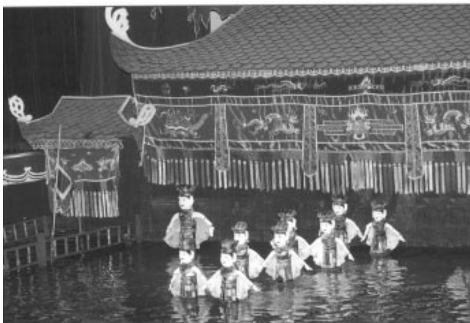
شانۆی بووکەشووشە ئاو

یازدە ئەکتەر، یان هونەرەندی بە سەلیقە کە بۆ ماوەی زیاتر لە سێ سال لە قوتابخانەییەکی تایبەتیدا خۆیندووینانە و خۆیان بۆ مەشقی تایبەتی راهێنان و بەکارهێنانی ئەو بووکەشووشانە نامادەکردوو، لە هەموو نەمایشیکدا بەشداری دەکەن. ئەکتەرەکان لە پشت چێخیکی لە قامیش دروستکراوی ڕەنگاو ڕەنگەو خۆیان شار دەوتەو، هەندێ لە بووکەشووشەکان بە داری زۆر درێژەو قایم کراوە، هەندیکێ تریان بەبنەمایەکی بزوێنەو، ئەم بنەمایەش بە داریکی درێژەو