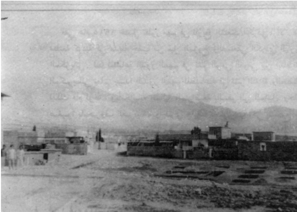
دیمینکی شاری سلیمانی، وینه که له سالی ۱۹۱۳-دا گیراوه.

سه‌رژمیتری شاری سلیمانی به‌هۆی ئەوه‌وه به‌ده‌ست بهینم، واته ئەوه‌ی له‌و سه‌رده‌مه‌دا له‌به‌رده‌ست‌مدا بوون هه‌ر ئەو سه‌رژمیتری شاری سلیمانییه که تا سالی ۱۹۸۶ بووه له لایه‌ن حکومه‌ته یه‌ک له‌ دوای یه‌که‌کانه‌وه به‌ په‌رسی کرایبیت، بۆیه هه‌ی ساله‌کانی دواتر نازانین، چونکه‌ دوای سالی ۱۹۸۶ و دواتر ئیتر راپه‌رین به‌رپا بوو و له‌وساکه‌وه‌ش تا ئەم‌پۆ سه‌رژمیتریکی دیکه‌ نه‌کراوه تا ئەو ژماره‌ نوییه‌ی دانیشتوانی شاری سلیمانی بنوسین.