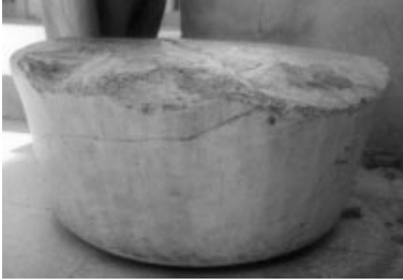
سهره نەستوونی مزگەوتی شیخ مستەفا

دەرگای پێش ئیسلامە. ئەگەر سەرە نەستوونە کە لە سەرەو نەشکابا کە پەنگە هەندێ نەخشی لەسەر بووبی - بەو نەخشانە دەمانزانی هێ کاتی چ دەولەتیکە.