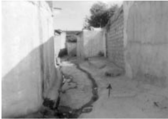
بەردی دەرگای رۆژھەلاتی شوورە شاری ھەولێر لەبەردەم ھەساری تەھا ناغا لای مزگەوتی شیخ مستەفا