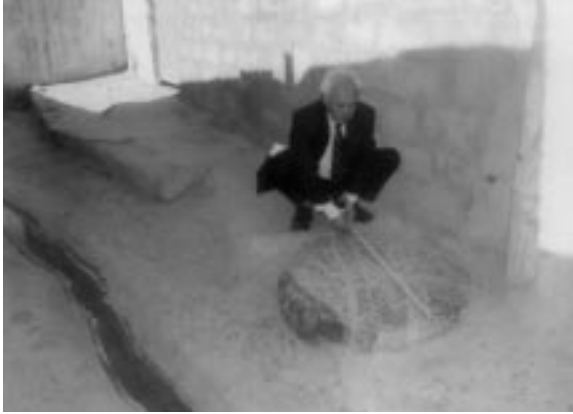
بەردی بەردەم حسار

وینەیم گرتوو، بەلام لە رۆژی ۱۸/۵/۲۰۰۶ دا کە چوو مەزگەوتە کە بەردە کە نە مابوو، لە کۆنەوه گوتراوه دەستی ئیمامی عەلی بوو، بەلام بەلای منەوه ئەو بەردە مەشخەلێکی ئایینی میترا (مەر) بوو کە لەو جۆرە مەشخەلە و لە شێوەی (پێ)ی مرۆفیشدا وینە مەشخەلێ میترا بێ لەسەر بەرد لە کوردستان هەیه لە ئاکرێ. (بەردە نەخشینە) لە (مولکی حەنا) لەلای قەبرستانیش دێی گراوی ژێر شاخی سەری رەش هەیه کە نزیکە لەو بەردە مەزگەوتی پەنجە عەلی (نەک پینج عەلی) سالی (۱۹۸۳) کە روانگەیهکی ئەستیره ناسی (مرصد فلکی) کوردەواریم لە گراو دۆزییەوه، ئەو بەردەش لەلای خەلکی گراووه پیشانم درا.