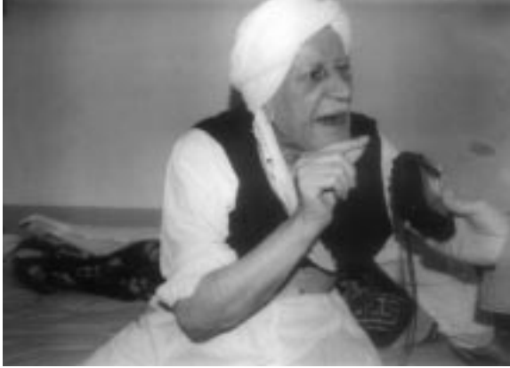
مهلا عومەر سوڤی حوسین

مووزه فەر لهو بیره بووه، ههروهها ئاوی (مدرسة الطین) و خانه قاکهش لهو بیبری دیکه بووه.