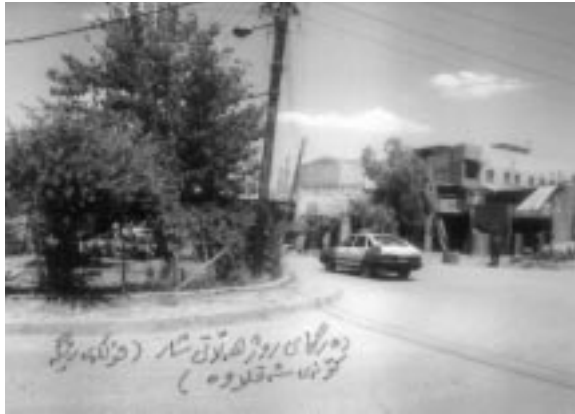
دەرگای رۆژهلاتی شار (فولکمی رینگه کۆندی شه قلاوه)

رۆژی سێیه می شهردا له گهڵ هیزی ههولپیر که رۆژی (۲۶ / تهمموزی ۱۲۳۳ ز) تا ئەم دەرگایه نه گرت و نه سووتاند له شکره که نهیتوانی له شووره دهربازی ببی و بگاته خه ندهک (خندق) ی ژبیر قهلات و نهیتوانی شاره که داگیربکات وهک میژوونوسی ههولپیر خوالیخوشبوو زوبیر بیلال له (اربیبل فی ادوارها التاريخیة) ل ۱۸۶ نووسیویه تی.